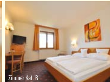
Zimmer Kat. B