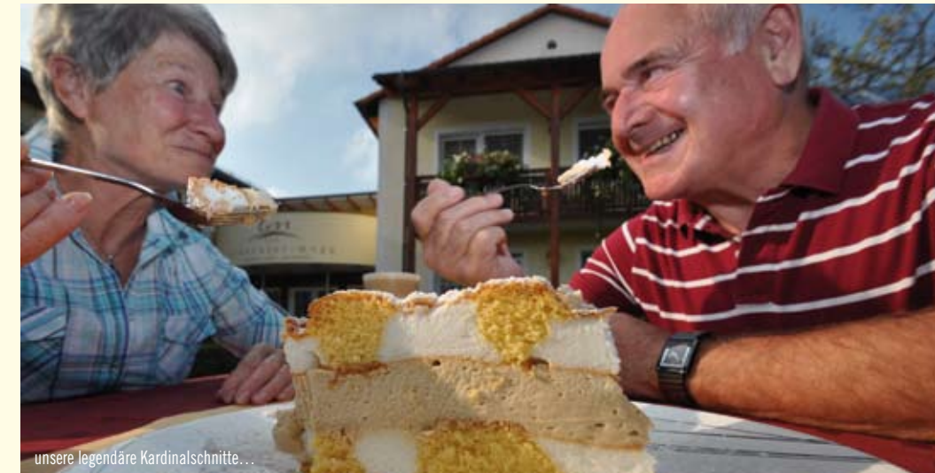
unsere legendäre Kardinalschnitte...