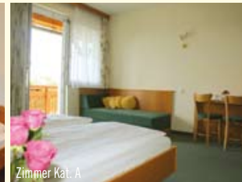
Zimmer Kat. A